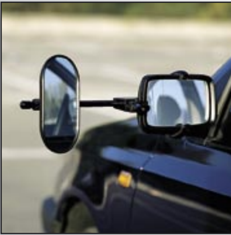
EMUK Spezial-Zusatzaußenspiegel für Wohnwagenbetrieb