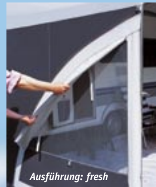
In der Ausführung „FRESH“ sind die Seitenwände mit Moskitogaze-Einsatz und Fensterklappe ausgestattet, die vor Zugluft und Sonneneinstrahlung schützt.