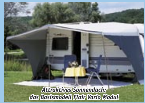
Attraktives Sonnendach: das Basismodell Flair Vario Modul