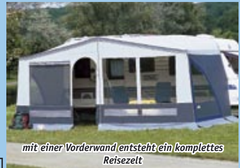
mit einer Vorderwand entsteht ein komplettes Reisezelt